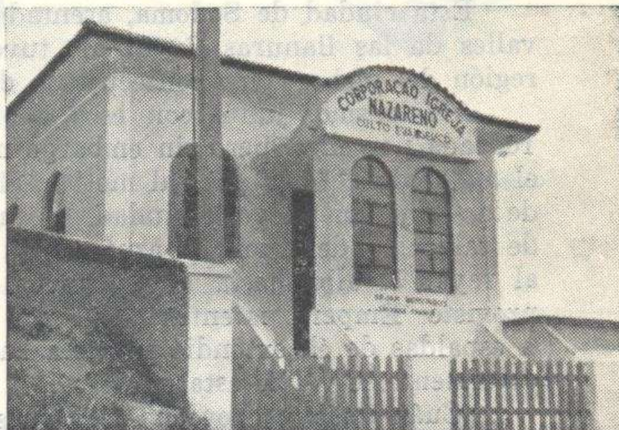
Frente del templo recientemente inaugurado