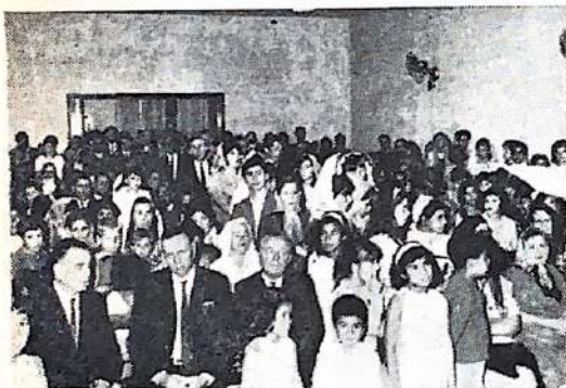
Vista interior de la concurrencia