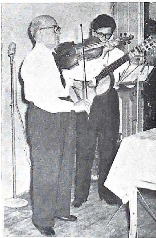
Dúo de violín y guitarra de la iglesia de Mariano Acosta.

Estuvieron presentes hermanos y amigos de las iglesias de Morón, Mariano Acosta, Sarandí y José León Suárez.