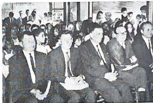
La congregación durante la reunión.