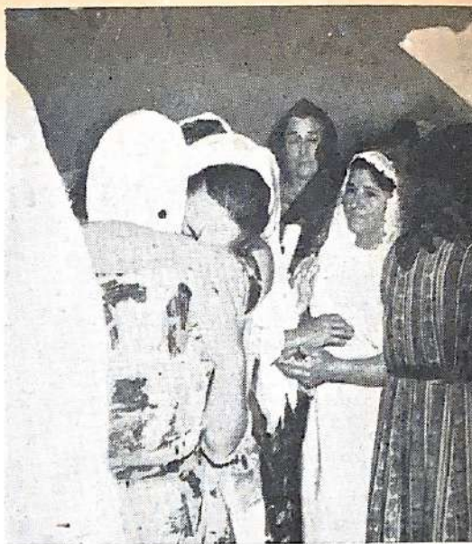
Los convertidos son saludados.

Luego y siempre en obediencia a las Santas Escrituras se efectuó el bautismo de Espíritu Santo según lo ordena el Señor: "Más vosotros seréis bautizados con el Espíritu Santo", Hechos 1:5.