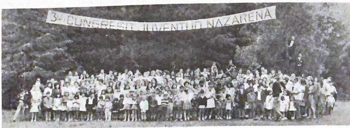
Vista general de los asistentes a la concentración.

Sin lugar a dudas este congreso fue muy distinto a los demás, tanto que algunos al retirarse preguntaron: "¿Fue un congreso?"; claro que sí, fue el tercer congreso que dio lugar así a un cuarto congreso, que Dios mediante, la juventud de Mariano Acosta nos preparará para 1966.